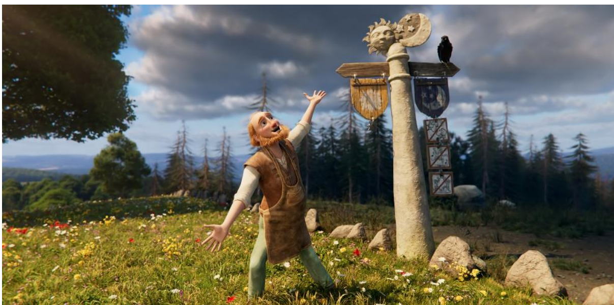
Hranice mezi Půlnočním a Slunečním královstvím