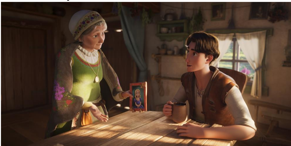
U Krasomiliny chůvy