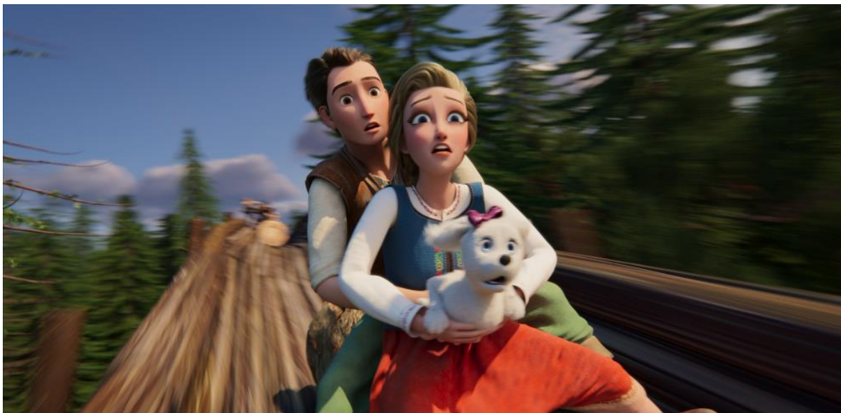
Jízda na kládě