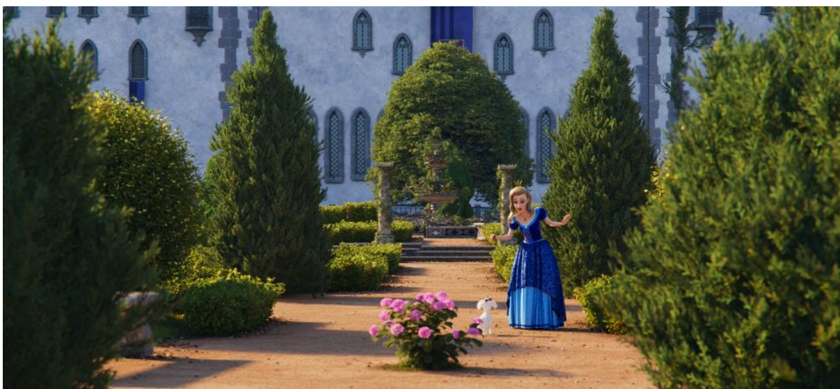
Zámecká zahrada Půlnočního království princezny Krasomily