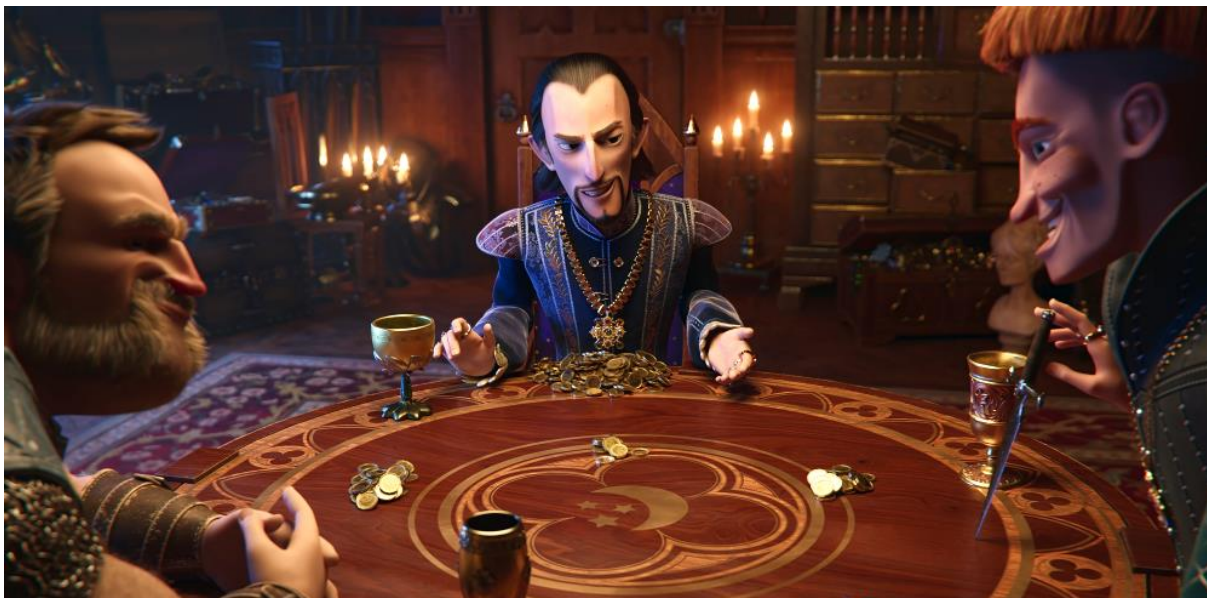
Rádcové ve své tajné komnatě