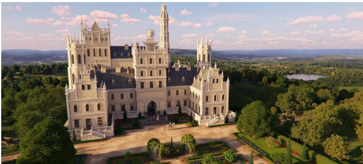
Zámek Slunečního království krále Miroslava