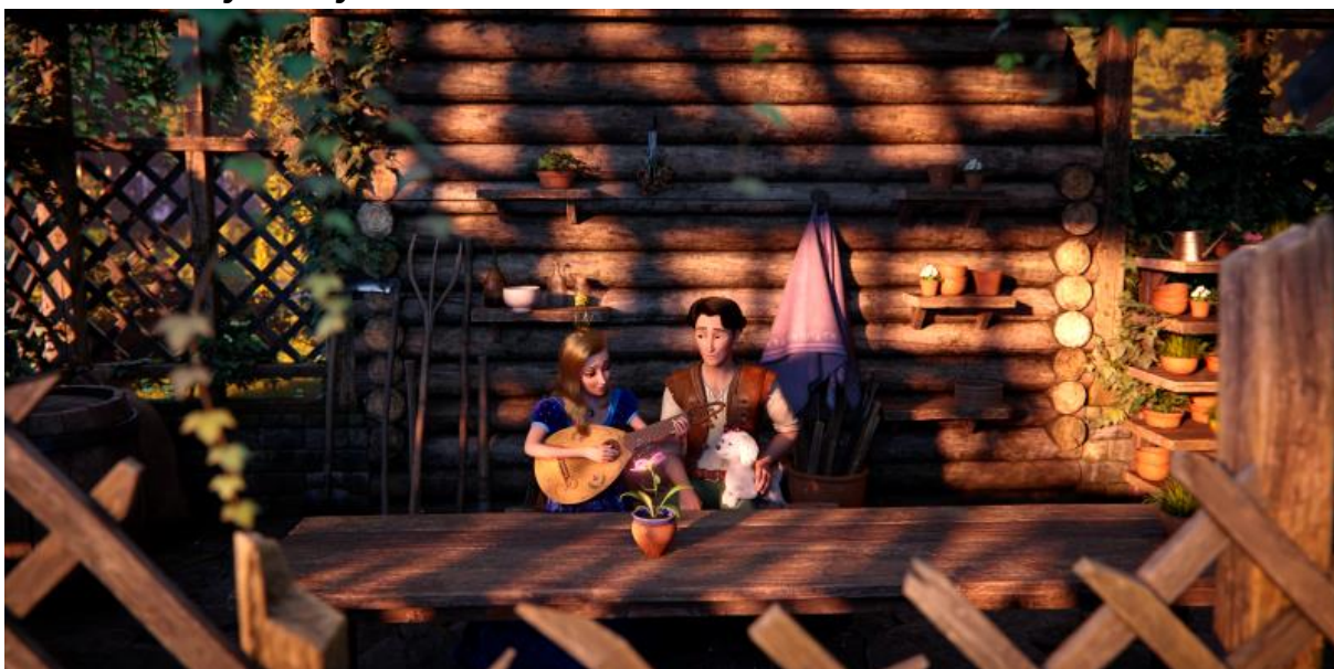
V zahradníkově domku